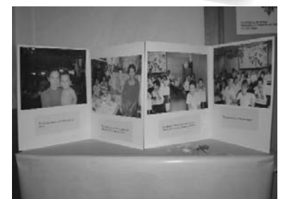
Exposición en nuestro cole