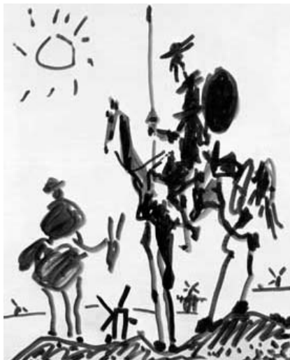
Don Quijote y Sancho Panza, Pablo Ruiz Picasso